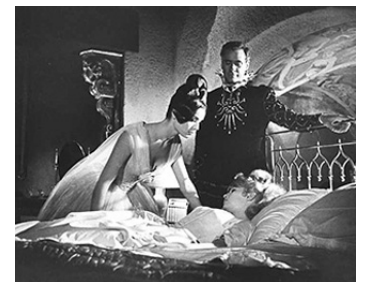
1960 ET MOURIR DE PLAISIR de Roger Vadim avec Elsa Martinelli, Annette Stroyberg