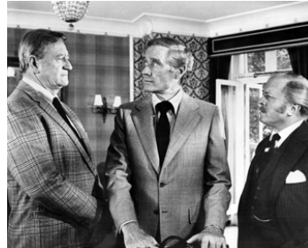
1974 BRANNIGAN (Joe Battle) de Douglas Hickox avec John Wayne, Richard Attenborough