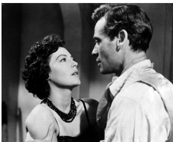
1957 LE SOLEIL SE LÈVE AUSSI (The Sun also rises) d'Henry King avec Ava Gardner