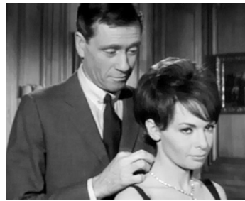
1962 LE DIABLE ET LES 10 COMMANDEMENTS de Julien Duvivier avec Françoise Arnoul