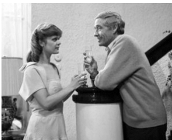
1978 ENTRE LES RAILS (Zwischengleis) de Wolfgang Staudte avec Pola Kinski