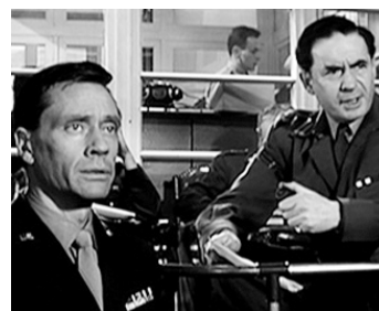
1961 LE JOUR LE PLUS LONG (The longest Day) de Ken Annakin avec Leo Genn