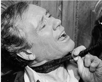
1973 L'ANTÉCHRIST (L'Antecristo) d'Alberto De Martino