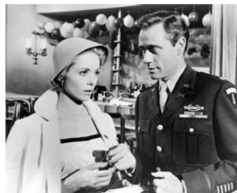
1958 TONNERRE SUR BERLIN (Fräulein) d'Henry Koster avec Dana Wynter