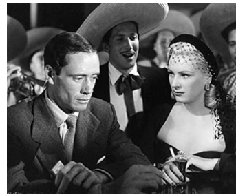
1950 LA CORRIDA DE LA PEUR (The Brave Bulls) de Robert Rossen avec Miroslava Stern