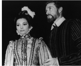
1964 LE GRÉCO (El Greco) de Luciano Salce avec Rosanna Schiaffino