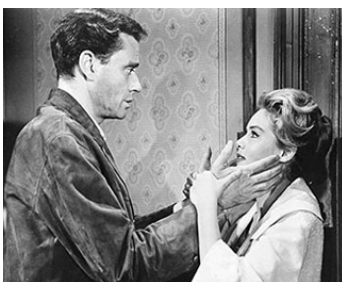
1960 LES MAINS D'ORLAC (The Hands of Orlac) d'Edmond T. Gréville avec Lucille Saint-Simon