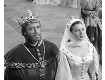
1953 LES CHEVALIERS DE LA TABLE RONDE de Richard Thorpe avec Ava Gardner