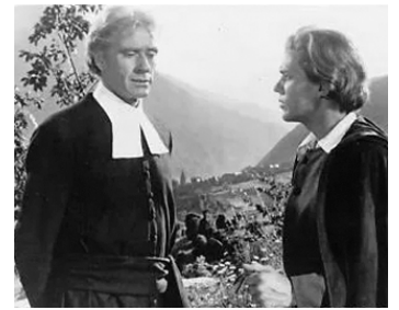
1963 MONSIEUR DE LA SALLE (El Señor de la Salle) de Luis Cesar Amadori avec Manuel Gil