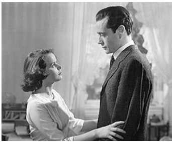
1949 FRONTIÈRES INVISIBLES (Lost Boundaries) d'Alfred L. Werker avec Beatrice Pearson