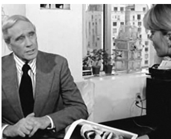
1979 LA SECTE DES CANNIBALES (Mangiati Vivi) d'Umberto Lenzi avec Janet Agren