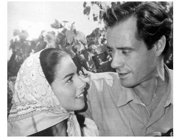
1957 LES VENDANGES (The Vintage) de Jeffrey Hayden avec Pier Angeli