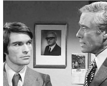
1974 LA VILLE ACCUSE (La Polizia accusa) de Sergio Martino avec Luc Merenda