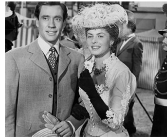
1956 ÉLÉNA ET LES HOMMES de Jean Renoir avec Ingrid Bergman