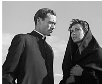
1954 DU SANG DANS LE SOLEIL (Proibito) de Mario Monicelli avec Lea Massari