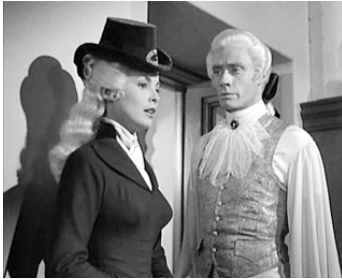
1952 SCARAMOUCHE (Scaramouche) de George Sidney avec Janet Leigh