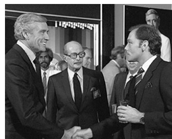
1981 MILLE MILLIARDS DE DOLLARS d'Henri Verneuil avec Jacques François, Patrick Dewaere