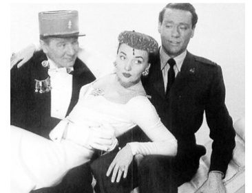
1955 OH, ROSALINDA (Fledermaus '55) de Powell et Pressburger avec M. Redgrave, L. Tchérina