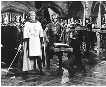
1961 LES LANCERS NOIRS (I Lancieri neri) de Giacomo Gentilomo