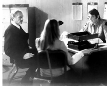
1976 LE CROCODILE DE LA MORT (Death Trap) de Tobe Hooper avec Stuart Whitman