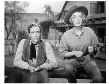
1951 L'ANGE DES MAUDITS (Rancho Notorious) de Fritz Lang avec Marlene Dietrich