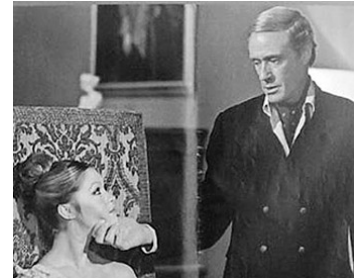
1972 LA DANSEUSE DU MOULIN-ROUGE (La Chica del Molino rojo) d'Eugenio Martin avec Marisol