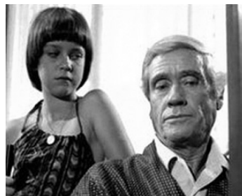
1978 L'IMMORALITÀ de Massimo Pirri avec Karin Trentepohl