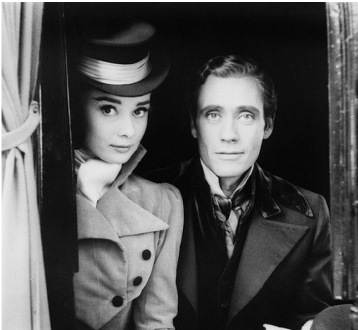
1956 GUERRE ET PAIX (War and Peace) de King Vidor avec Audrey Hepburn