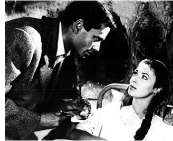
1953 SAADIA (Saadia) d'Albert Lewin avec Rita Gam