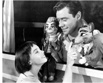
1953 LILI (Lili) de Charles Walters avec Leslie Caron