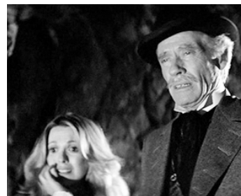
1979 LE CONTINENT DES HOMMES-POISSONS de Sergio Martino avec Eunice Bolt