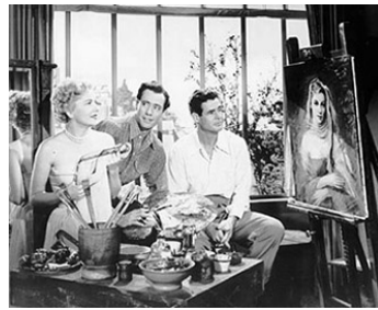
1950 LE LIT DE ROSES (Born to be bad) de Nicholas Ray avec Joan Fontaine, Robert Ryan