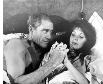
1970 LE TEMPS D'AIMER (Time for Loving) de Christopher Miles avec Joanna Shimkus