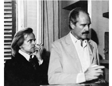
1975 LE FILET (Das Netz) de Manfred Purzer avec Klaus Kinski