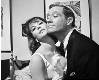
1964 UNE VIERGE SUR CANAPÉ (Sex and the single Girl) de R. Quine avec Natalie Wood