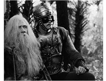
1978 THORVALD LE VIKING (The Norseman) de Charles B. Pierce avec Lee Majors