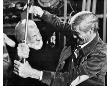
1977 LE RETOUR DU CAPITAINE NEMO (The Return of Captain Nemo) d'Alex March avec José Ferrer