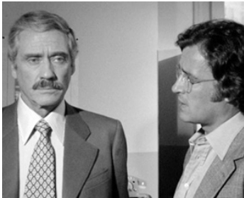
1975 À EN CREVER (Morte sospetta di una minorenne) de Sergio Martino avec Claudio Cassinelli