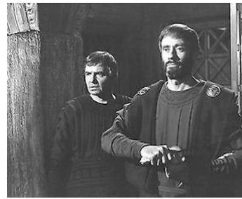
1963 LA CHUTE DE L'EMPIRE ROMAIN (The Fall of the roman empire) d'A. Mann avec J. Mason