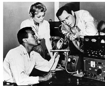
1958 LE MONDE, LA CHAIR ET LE DIABLE de Ranauld MacDougall avec Harry Belafonte, Inger Stevens